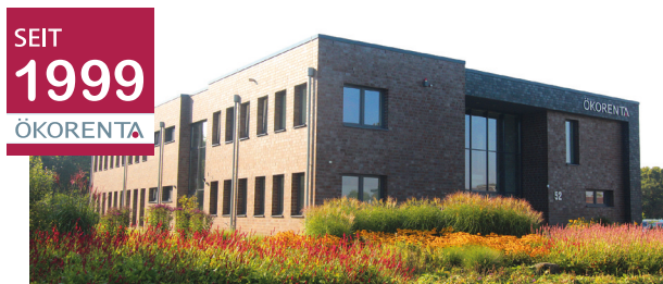
ÖKORENTA-Firmengebäude in Aurich, Ostfriesland

Zum Zeitpunkt der Auflage des Fonds sind weder Vermögensgegenstände erworben, noch stehen konkrete Vermögensgegenstände fest. Sie können sich vor der vertraglichen Bindung an die Fondsgesellschaft insofern kein vollständiges Bild über die Vermögensgegenstände und die damit verbundenen Risiken und Ertragschancen verschaffen. Anleger:innen gehen mit einer Beteiligung eine langfristige Verpflichtung ein - eine Veräußerung an Dritte ist nicht sichergestellt. Für eine vollständige Darstellung der Risiken sollten sie die Risikohinweise im Verkaufsprospekt vom 22. Juli 2022 im Kapitel „Risiken“ lesen. Der Verkaufsprospekt und das Basisinformationsblatt sind kostenlos in elektronischer Form auf unserer Website unter www.oekorenta.de/downloads und in gedruckter Form in deutscher Sprache bei der Auricher Werte GmbH, Kornkamp 52, 26605 Aurich oder bei Ihrem Berater erhältlich.